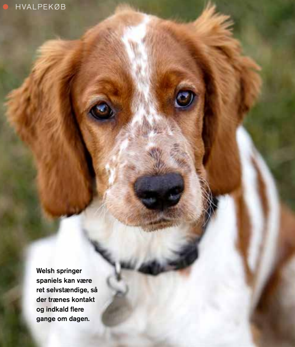
Welsh springer spaniels kan være ret selvstændige, så der trænes kontakt og indkald flere gange om dagen.